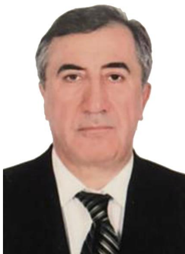
Черкесов Азизбек Улубиевич Председатель Общественной палаты РД